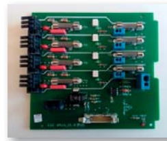
4-fach Leistungskarte (15A)