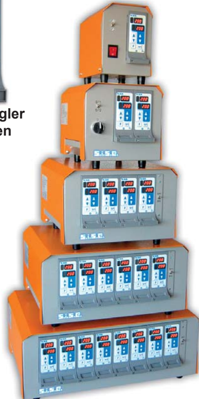
Reglergehäuse 8 Series für 2 Zonen

Die Heisskanaltemperaturregler 8-Series wurden speziell für Anwendungen mit einer geringen Anzahl von Regelstellen entwickelt, besonders für den Automobilbereich oder für technische Kunststoffteile.