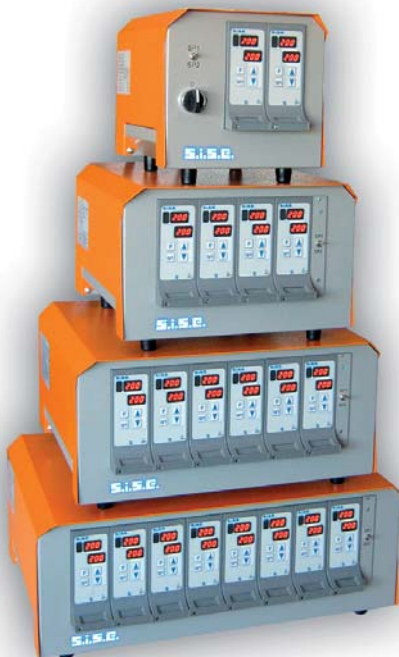
Reglergehäuse 8 Series für 1 Zone