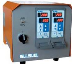
Reglergehäuse 8C2D- 4 Zonen Konfiguration PREMIER