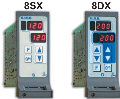
Einschubregler für 1 Zone Einschubregler für 2 Zonen