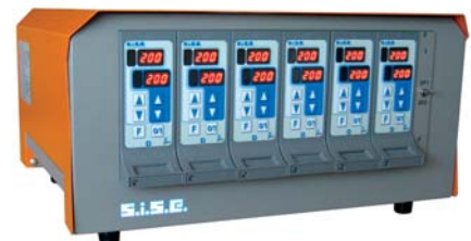
Reglergehäuse 8C6D -12 Zonen Konfiguration COM