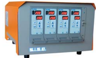
Reglergehäuse 8C4S - 4 Zonen MONOZONE EINSCHUBREGLER