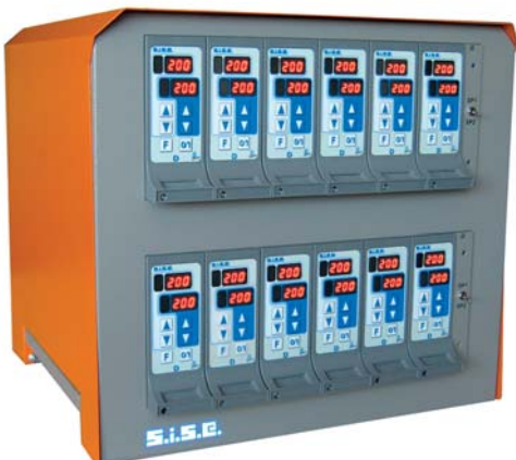
Reglergehäuse 8CH6D- 24 Zonen Konfiguration PREMIER