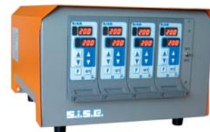
Reglergehäuse 8C4D - 8 Zonen Konfiguration PREMIER

Damit wird gleichzeitig eine lange Lebensdauer der Heizelemente und die Einhaltung der CEM-Normen gewährleistet.