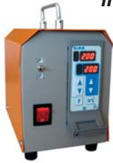
Reglergehäuse 8C1D - 2 Zonen Konfiguration PREMIER

Mit den 8-Series-Reglern werden zwei Schnittstellenniveaus angeboten, um jeder Anwendung, vom der einfachsten bis zu hochentwickelten gerecht zu werden, insbesondere die Kommunikationsfähigkeit zu Euromap 17/66, CAN Bus, USB und RS 232/485.