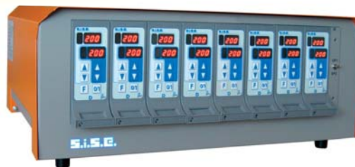
Reglergehäuse 8C8D - 16 Zonen Konfiguration COM